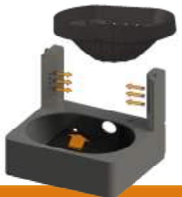
4-степенно изгаряне, което гарантира ниски емисии и висока ефективност

Доставя се без циркуляционна помпа и разширителен съд