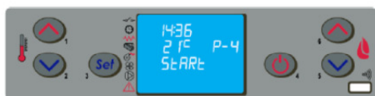
Табло за управление