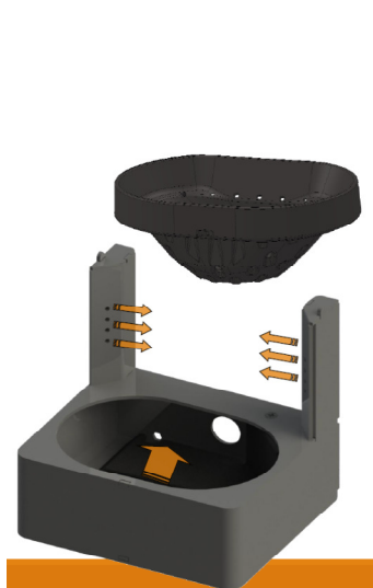
4-степенно изгаряне, което гарантира ниски емисии и висока ефективност

Доставя се без циркуляционна помпа и разширителен съд