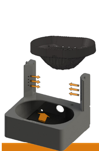
4-степенно изгаряне, което гарантира ниски емисии и висока ефективност

Доставя се без циркуляционна помпа и разширителен съд